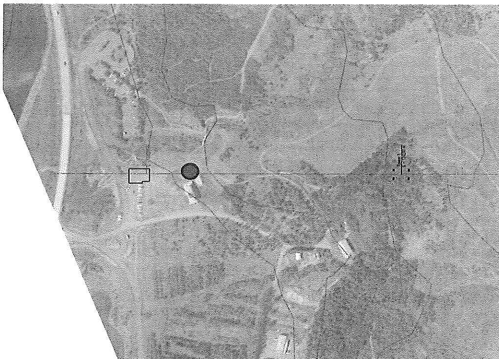
Mynd 1.1 Staðsetning upphafsstöðvar (rauður kassi). Blár punktur táknar staðsetningu eins og hún var kynnt í fyrirspurn um matsskyldu.